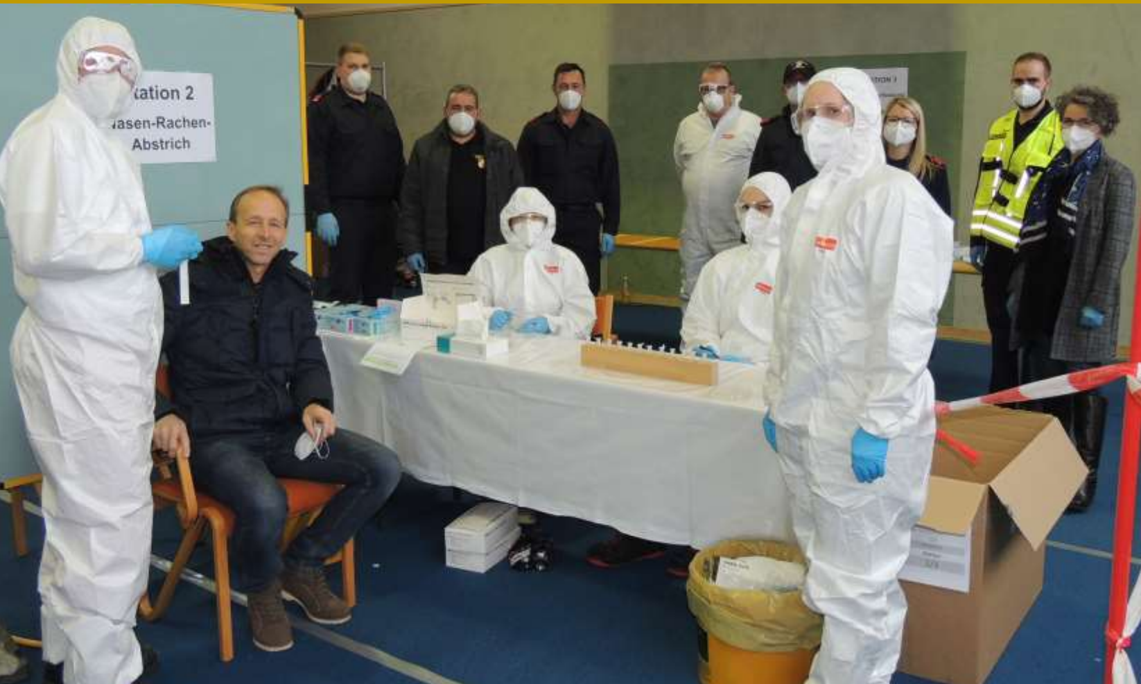
COVID-19-Massentests - Turnsaal der Volksschule

NACHRICHTEN UND INFORMATIONEN DER MARKTGEMEINDE HOHENEICH