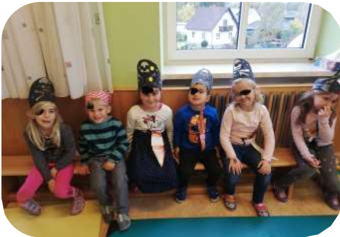
Die Piraten sind los!