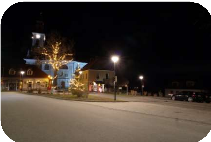
'Peitsche', 'Neonröhre', 'Kugel' und 'Schwammerl' adé. Nicht nur der weihnachtliche Marktplatz erstrahlt nun in neuem Licht.

Erfreuliches gibt es aktuell zum Thema Energie zu berichten. Durch gezielte Maßnahmen und sinnvollen Einsatz von Fördermitteln gelingt es der Gemeinde Hoheich-Nondorf seit Jahren, den Energieverbrauch nachhaltig zu reduzieren, mit positiven Auswirkungen auf Umwelt und Gemeindefinanzen. Eine der größten Veränderungen gegenüber den Vorjahren ist bei der Straßenbeleuchtung zu beobachten: Die bestehende Straßenbeleuchtung aus einem „Mischmasch“ an Leuchtstoffröhren, Natrium- und Quecksilberdampflampen wird nun auch in Hoheneich, wie bereits schon in Nondorf, sukzessive durch zeitgemäße LED-Beleuchtung ersetzt. Die bestehenden Masten wurden gekürzt bzw. mit Überschubrohren verlängert. Masten in schlechtem Zustand wurden im Zuge des Austausches ersetzt. Neben einer Energieeinsparung durch den Einsatz von Leuchtmitteln mit großteils 18 Watt gegenüber 50-80 Watt wird auch die Lichtqualität merklich verbessert, indem die Lampen exakt an die Straße angepasst werden. Die Stärke der neuen Leuchten kann zudem in den Nachtstunden angepasst und abgesenkt werden. Störendes Streulicht in Häuser und Vorgärten sowie in den Nachthimmel wird somit auf ein Minimum reduziert.